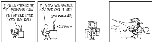
Abbildung: xkcd.org - goto